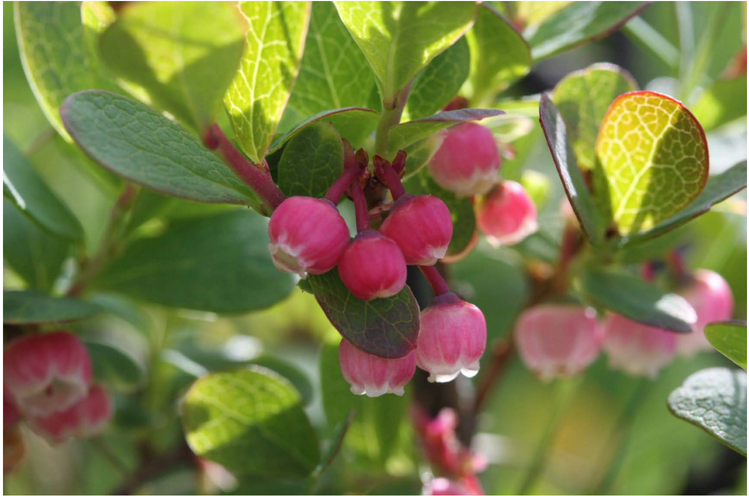
Landsbyggð tækifæranna – Þekkingar – og fræðastarf á landsbygðinni